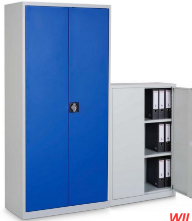
Bsp.: Willy + Willy ML

Betriebsausstattung | Industriemöbel | Bauelemente