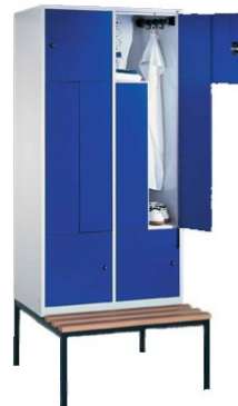
Beispiel mit untergebauter Sitzbank

Neue Türfarben! Jetzt auch in weiss u. apfelgrün